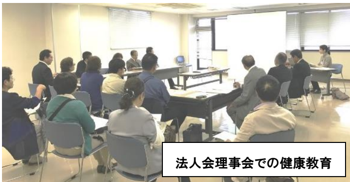
法人会理事会での健康教育