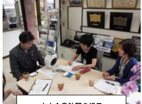
中小企業訪問の様子