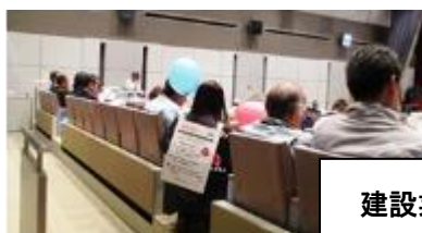
建設業の大会で結核予防啓発