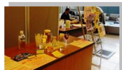
建設業の大会で適正飲酒の啓発