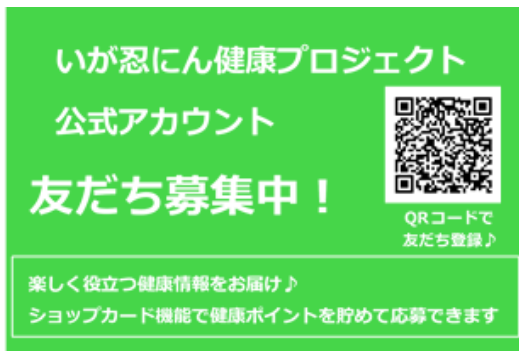
<LINE 公式アカウント友だち登録用 QR コード>