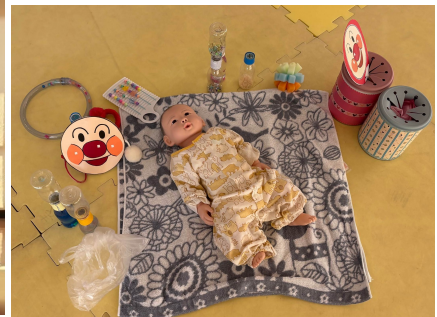
手作りのおもちゃ