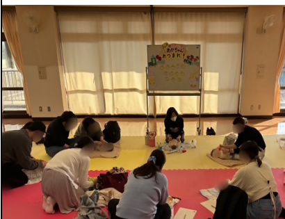
遊び方講座の様子