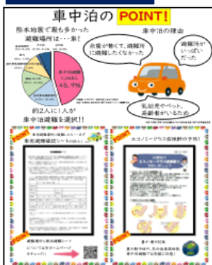
令和6年度作成ポスター