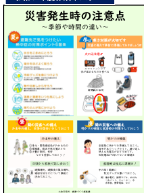
令和7年度作成ポスター