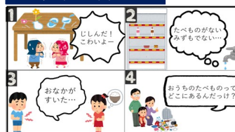
ローリングストックマンガ